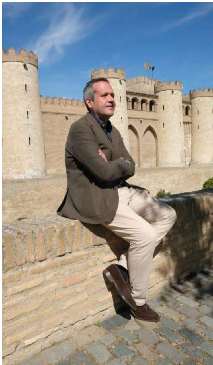
Carlos Ortas, candidato de Ciudadanos a la Presidencia de Aragón.

«Tenemos claro que la caza es una actividad estratégica para Aragón y, más en concreto, para el medio rural. Desde la coalición Ciudadanos Tu Aragón somos conscientes de la riqueza que genera su actividad desde las vertientes lúdicas y deportiva»