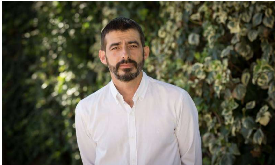
Álvaro Sanz, candidato de Izquierda Unida a la Presidencia de Aragón. IU

Candidato de Izquierda Unida a la Presidencia de Aragón