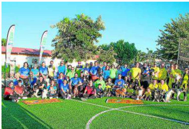
Foto de familia de los participantes aragoneses.

Como ya ocurriera en ediciones anteriores, los aragoneses, formados por los clubes de Agility de nuestra comunidad Indog, La Almozara, La Ribera, Saroca, Toskahua y Zarajump, dejaron el