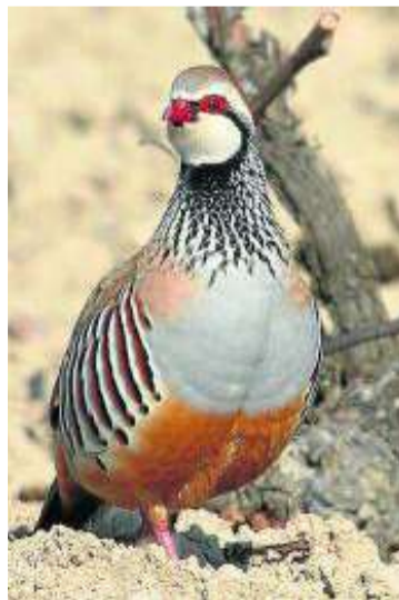
Una perdiz en un viñedo. o. c.

El censo de bandos de perdiz tiene como principal objetivo diferenciar entre perdices adultas y jóvenes y, de esta forma, evaluar la temporada de cría, un dato clave para planificar un correcto aprovechamiento cinegético.