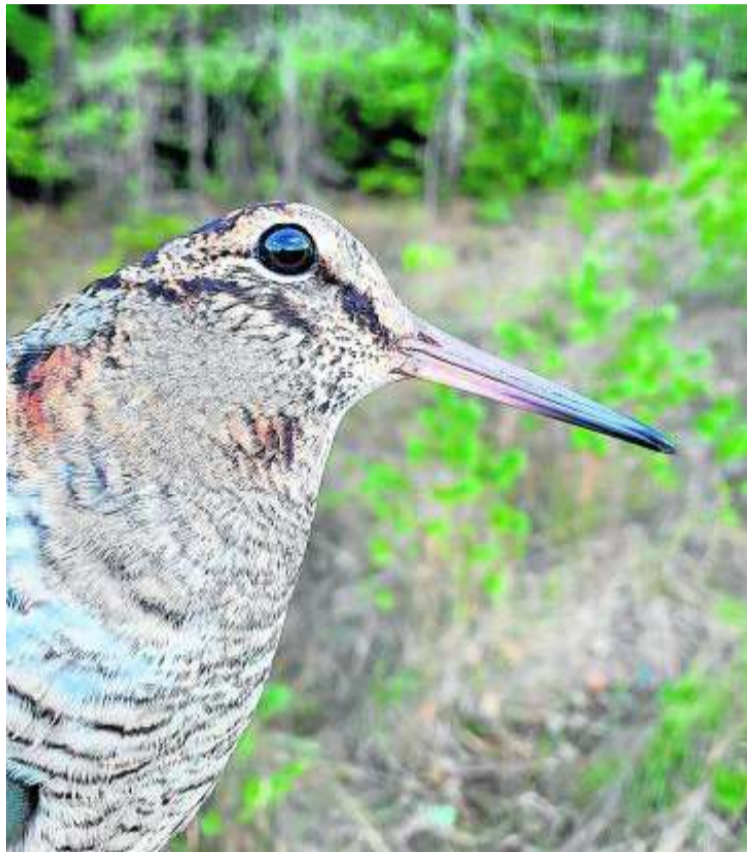
Imagen de una becada.

La web de recogida de datos del Proyecto Becada se puso en marcha en 2006 y se ha diseñado como un auténtico cuaderno de caza para el registro de datos de jornadas cinegéticas de cualquier cazador que se dé de alta en el mismo. Se conforma con una serie de formularios en el que se recogen campos obligatorios, cuya información nutre al análisis de resultados del proyecto, tales como duración de la jornada, número de