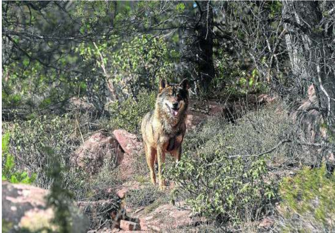
Ejemplar de lobo ibérico, en el parque faunístico La Maleza.

El ejecutivo autonómico, continúa la misiva remitida al ministerio de Teresa Ribera, «ha tratado de paliar los efectos de la acción del lobo sobre la ganadería a través de la promulgación de la Orden por la que se convocan subvenciones para la adaptación de