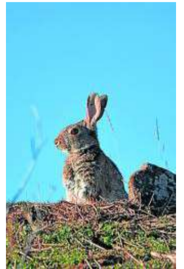
Un conejo de monte.