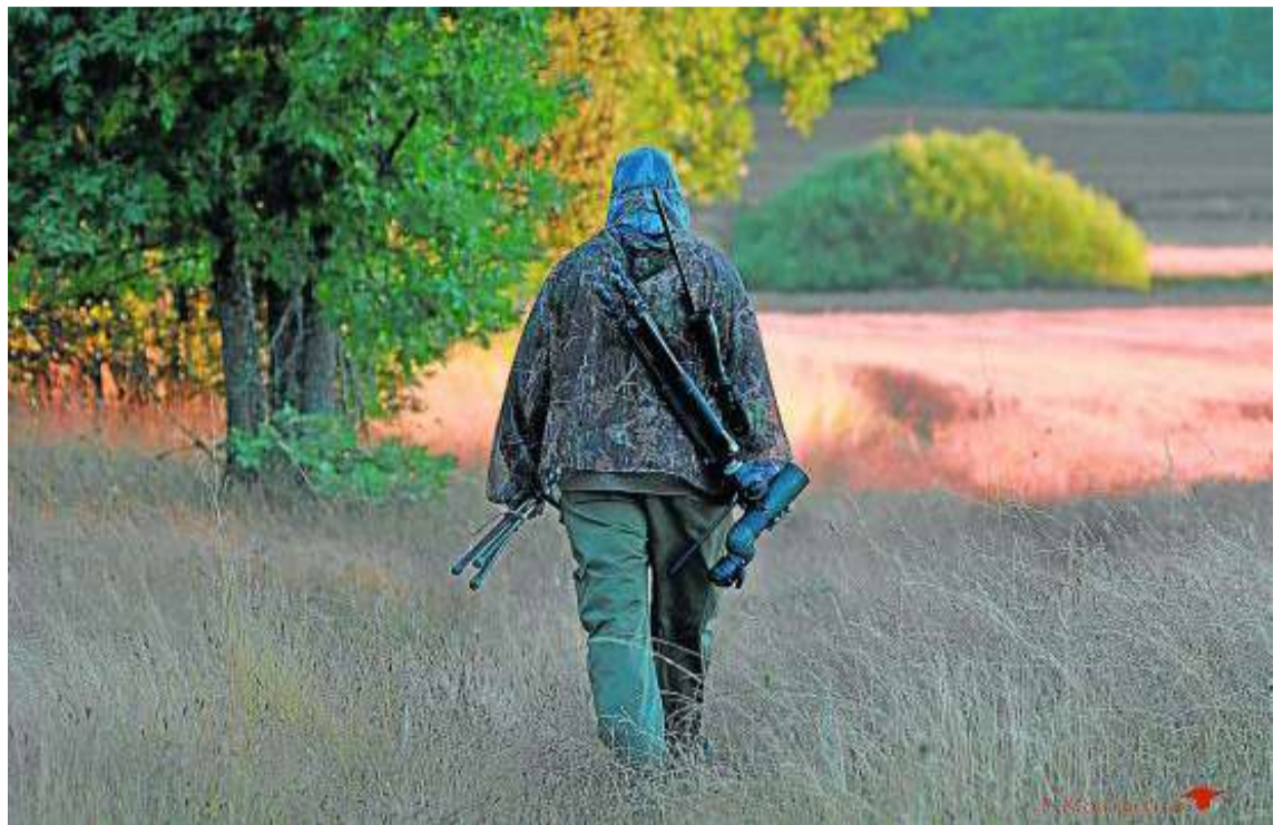
Un cazador se dirige hacia un puesto durante una batida de caza mayor. J. MANZANO

Otra novedad a reseñar es la que establece que para los hurones utilizados en la caza en Aragón no existirá obligación de registrarlos ante la Administración aragonesa ni de dotarlos de un microchip de identificación, pero se fija que su dueño deberá tener licencia de caza válida en Aragón. Respecto del control del conejo en zonas no cinegéticas mediante modalidades distintas de la caza con hurón en madriguera sólo se podrá autorizar a «personas cazadoras habilitadas» y FARCAZA llevará un registro de las mismas.