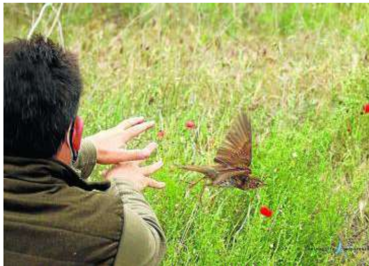
Suelta de un zorzal en el marco del proyecto. FUNDACIÓN ARTEMISAN

El Proyecto Zorzales pretende monitorizar la abundancia y distribución de las poblaciones de zorzales para conocer sus tendencias. Esta es una tarea que mejorará el conocimiento disponible sobre los flujos migratorios