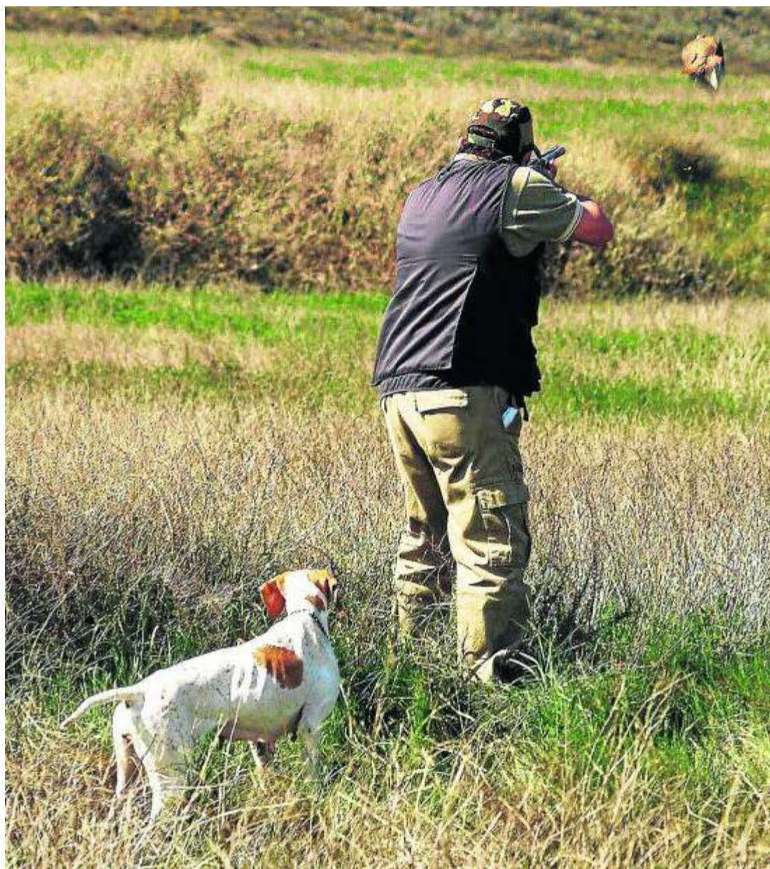
Un cazador, con la escopeta encarada, a punto de disparar a una perdiz que levanta el vuelo.

Pero de nada vale este esfuerzo sin la inestimable ayuda de los cazadores y de sus sociedades deportivas. El año pasado, primera temporada del proyecto Coturnix, solo una pequeña parte de