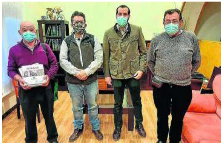
En febrero hubo una reunión de coordinación del proyecto. HA

tuasport, que devuelve así la confianza que los cazadores depositan en la entidad apoyando proyectos para defender la caza sostenible.