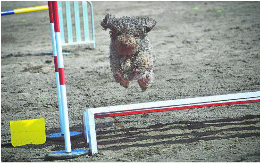
Uno de los perros participantes en la modalidad Junior, durante un momento del campeonato.

COMPETICIÓN Cabañas de Ebro acogió el primer fin de semana de mayo el campeonato autonómico, con decenas de participantes en modalidades Adulto y Junior