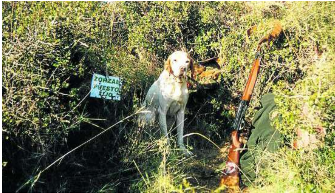
En la imagen, un puesto de caza de zorzales. HERALDO

Todo, para lograr establecer la mayor base de datos de zorzales existente en España, labor que ya se está efectuando gracias a la implicación de 250 colaboradores y que es posible gracias a la apuesta por la investigación y la conservación que está llevando a cabo la aseguradora Mu-