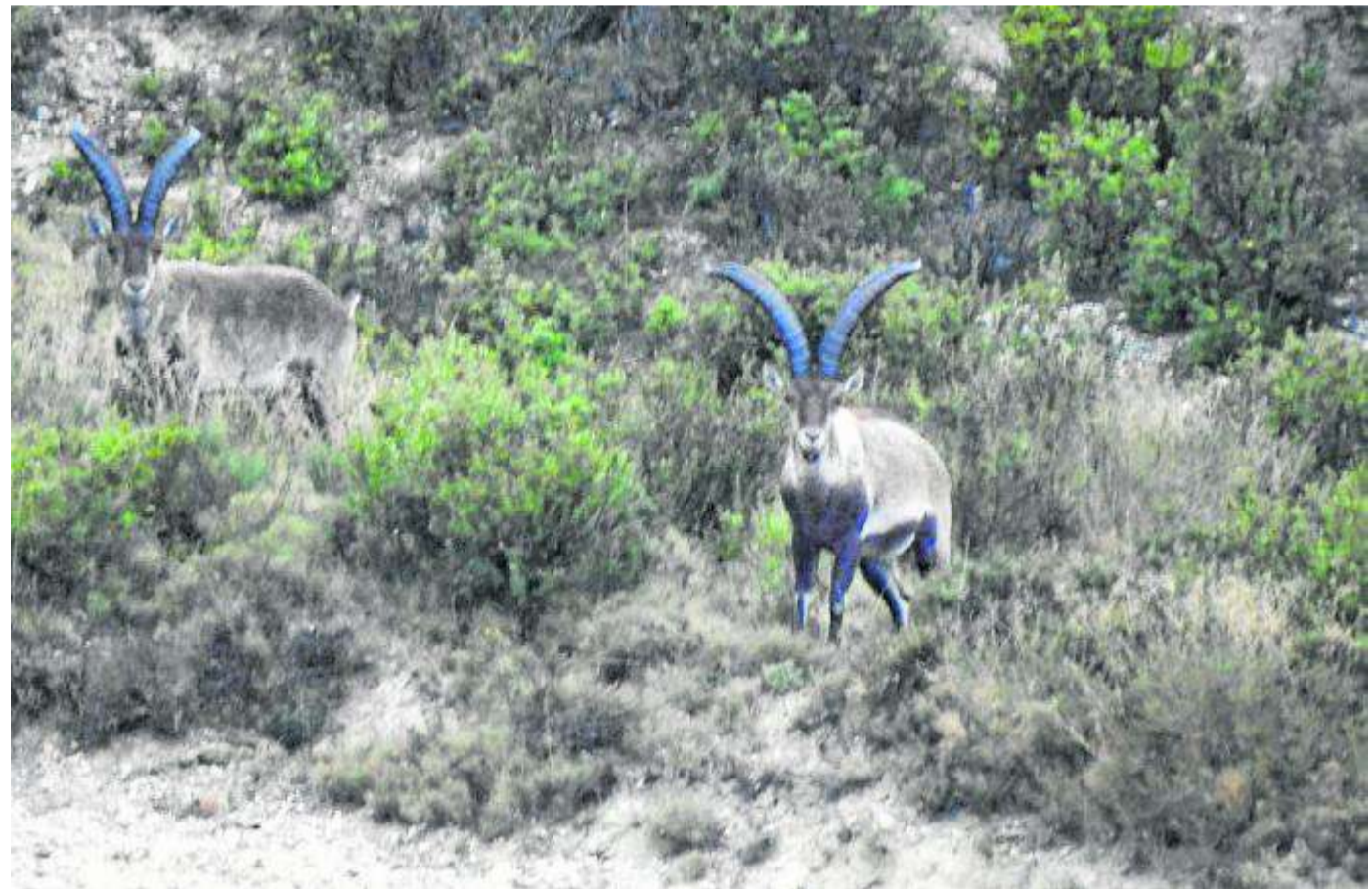
Páginas 2-3 Ejemplares de cabra hispánica en Aragón, especie que ha experimentado una importante expansión.

Antes de que se declarara este brote, la Diputación General de Aragón ya estableció un protocolo de actuación para las sociedades de cazadores en cuyos cotos puedan darse casos de sarna en la cabra. Dichas sociedades disponen desde el primer momento del denominado precinto sanitario, mediante el que pueden cobrar ejemplares enfermos sin límite y sin afectar a los cupos.