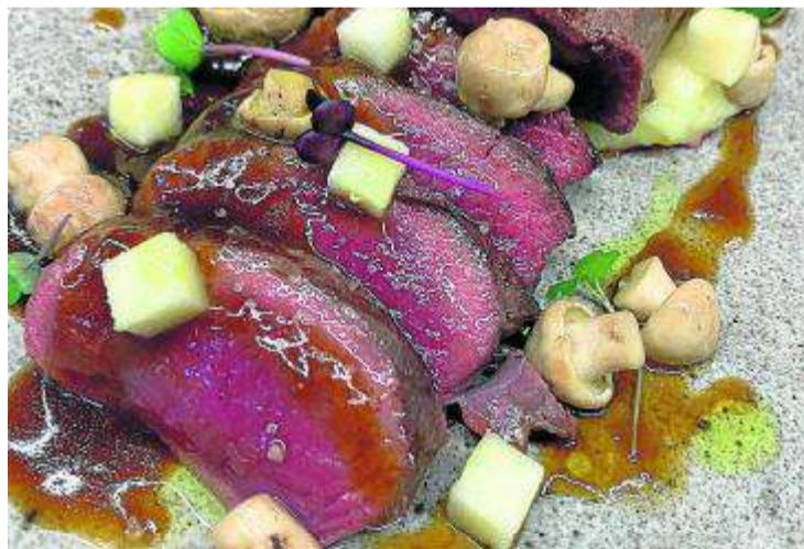
Imagen del plato acabado y listo para degustar.

Para su elaboración se necesita: un lomo de corzo, dos kilos de huesos de corzo, medio litro de vino DO Somontano, cuatro zanahorias, dos cebollas, medio kilo de tomate rosa de Barbastro, un puerro, una cabeza de ajos, una ra-