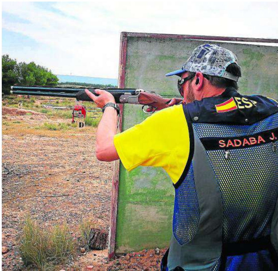
Imagen de caza de esta temporada.

Con el fin de favorecer la recuperación de sus poblaciones, se