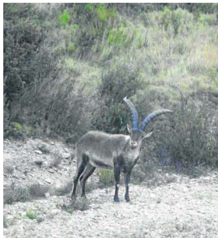
Ejemplar de cabra hispánica. JESÚS COTÉ

miento cinegético revierta en su práctica totalidad en el territorio, en los ayuntamientos o en el propio monte donde se gestiona esa caza.