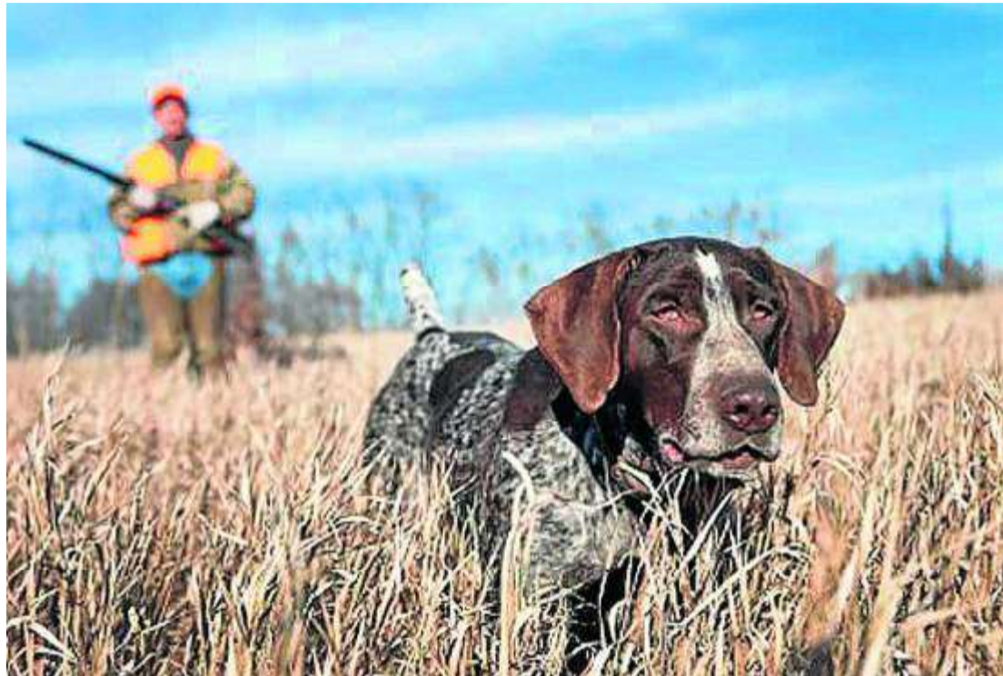
Un cazador observa la muestra de su perro durante una jornada de caza.

La realidad es que el Gobierno infló un 1.600% las cifras de fallecidos en accidentes de caza. Así lo revelan los datos del Ministerio del Interior a los que tuvo acceso 'El Confidencial'. Estos revelan